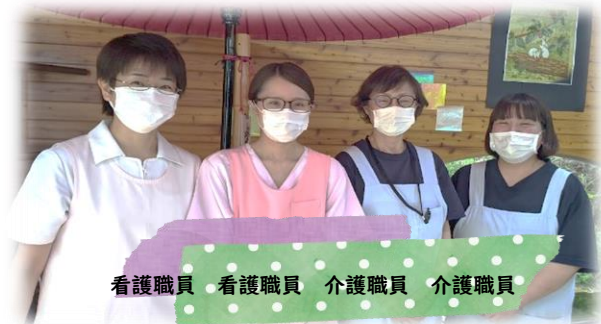
看護職員 看護職員 介護職員 介護職員

広島県に緊急事態宣言が出て ますます生活しにくくなりました。 沈んだ気持ちを前向き に明るく生活したいですね。